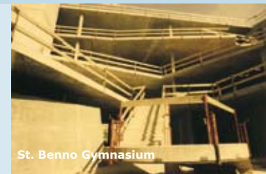
St. Benno Gymnasium